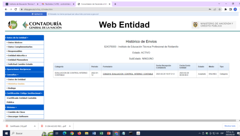
IMAGEN 3: Evidencia envío informe Control Interno Contable 2022 - INTEP