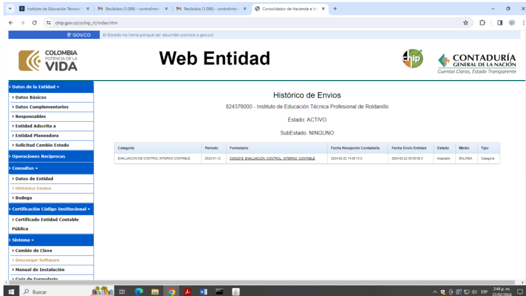
IMAGEN 2: Reporte informe Evaluación Control Interno Contable vigencia 2023