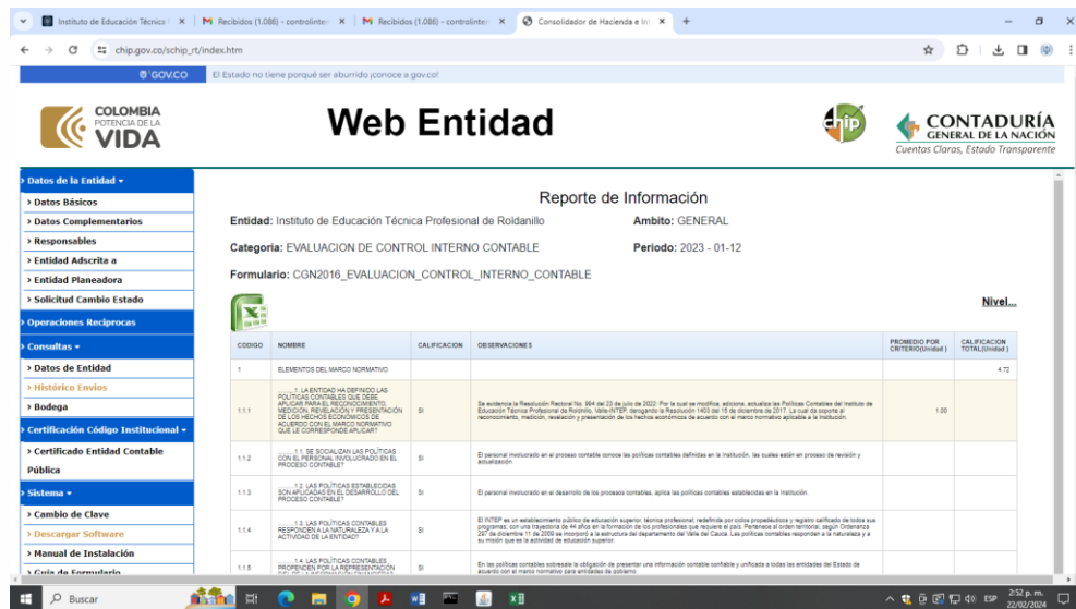
IMAGEN 4: Evidencia informe recibido CHIP