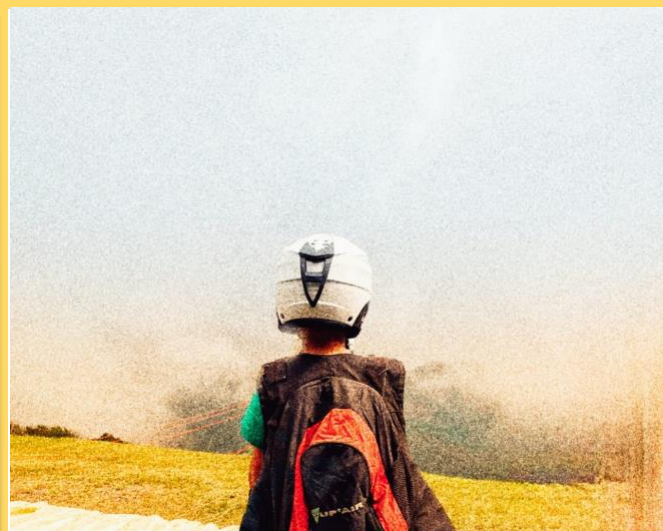
Niño viendo al horizonte.

“En el momento que salimos a volar te da una sensación de felicidad, de libertad, y lo primero que dije es: esto lo necesito aprender solo, porque el cuate este que viene aquí atrás ni lo conozco ”