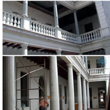
Cambio de pisos de madera por concreto.

Tras un temblor que sacudió la región, se llevaron a cabo renovaciones significativas. El piso de madera, que había sido testigo de generaciones de estudiantes, fue reemplazado por baldosas, eliminando así los crujidos que solían acompañar los pasos. Las ventanas de madera cedieron ante el avance del metal, y el techo de tejas de barro gigantes fue sustituido por una estructura de concreto y metal (Gil, 2023). 4 Estos cambios modernos permitieron que el edificio se mantuviera en sintonía con los tiempos sin perder su valiosa herencia.