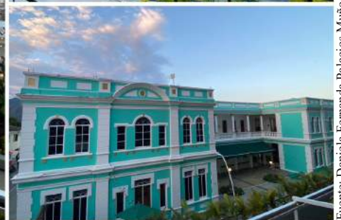
Actualmente el edificio luce de esta forma y es utilizado como sede administrativa del Instituto de Educación Técnica Profesional de Roldanillo - INTEP.

Entre sus alumnos más ilustres se encuentra el renombrado artista Omar Rayo, quien dio sus primeros pasos educativos en estas aulas.