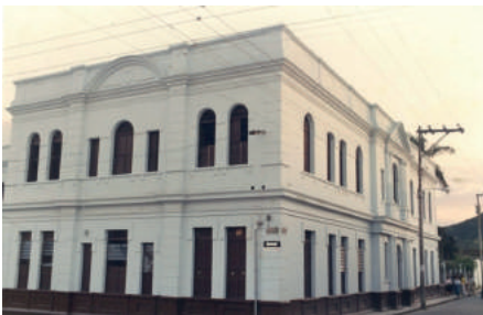
Fotografía posterior a la remodelación por deterioro.

En cierto momento, el Edificio REPUBLICANO estuvo al borde de la demolición debido a su avanzado deterioro. Sin embargo, el rector de la Normal defendió apasionadamente su preservación, y gracias a su persistencia, se optó por renovar y fortalecer la estructura sin alterar su diseño original. (Madrid, 2023)