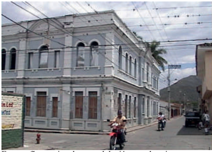
Fotografía previa a la remodelación por deterioro.