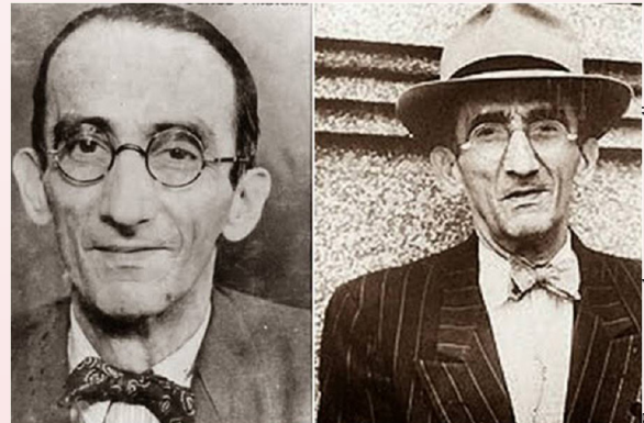
Carlos Villafaña, poeta colombiano, letrista del tema “Nadie me Espera”

Escribió una novela de carácter histórico la cual fue llevada a la televisión y narra valiosamente la cultura y las costumbres de la época: “El Alférez Real.”