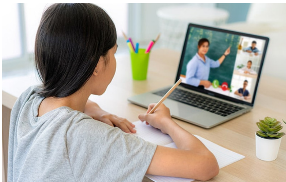
Educación Virtual Durante la Pandemia del 2020