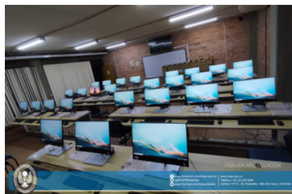
Sala de sistemas N°4 del INTEP

Henao (2023), reconoció que la motivación a los docentes se reconoce como la estrategia principal ya que ha sido la mayor problemática, se necesita el apoyo de los maestros para que las herramientas sean utilizadas adecuadamente, esto hace la metodología más efectiva tanto para los maestros como para los estudiantes.