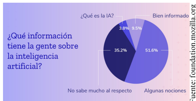
Gráfico creado por Fundación Mozilla

INTEP (Gutierrez, 2023) “ La inteligencia artificial llego para quedarse, y nosotros tenemos que acoplarnos como tal a esta inteligencia artificial y como sacarle el beneficio”