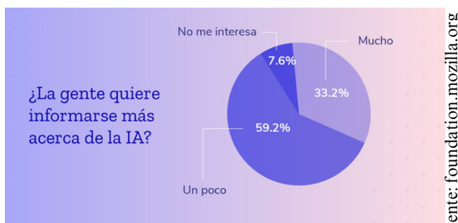
Gráfico creado por Fundación Mozilla

Debemos de ser conscientes que se pueden ver afectados ciertos cargos en una empresa, que al pasar de los años la inteligencia artificial va ir ocupando más tareas, pero si es bien decirlo, por más que lo realice la inteligencia artificial, debe de tener una supervisión de un humano, ya que somos los que tenemos la imaginación ilimitada, así como se reducen algunos cargos, se comienzan a crear otros, ya con unos estudios más avanzados