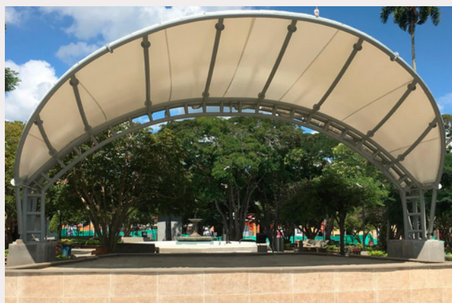
monumento al parapente; Roldanillo - Valle

De las calles polvorientas y empedradas que se veían en nuestro municipio en la época de los 70 y 80 vemos ahora el progreso de nuestro pueblo mágico con unas calles en buen estado y una vista más moderna, de ser nuestra tierra del alma pasamos a ser un pueblo mágico donde recibimos constantemente la visita de una gran cantidad de personas de otros países y de otras ciudades los cuales vienen a disfrutar de nuestras vistas y nuestros espacios públicos.