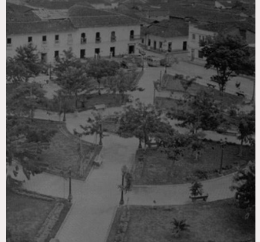
parque principal Roldanillo

En resumen, durante los años 70 y 80, Roldanillo se convirtió en un importante centro cultural y artístico en el Valle del Cauca debido a la presencia de figuras destacadas, organizaciones y eventos que contribuyeron a su desarrollo y expansión a nivel nacional e internacional.