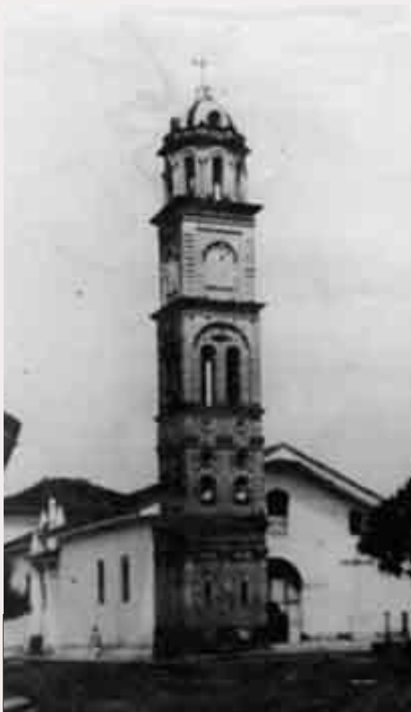
Torre antigua de la iglesia de san sebastián

E n los años 70 y 80, Roldanillo Valle se convirtió en un centro cultural importante en el Valle del Cauca debido a la presencia de artistas famosos, la construcción de emblemáticas y la organización de eventos deportivos y culturales que tuvieron un gran impacto nacional.