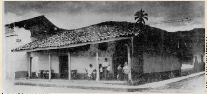
Corredor Polaco en el pasado.