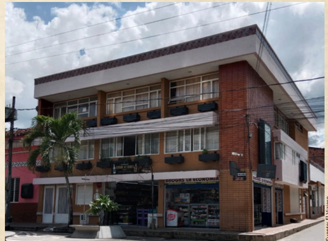
Droguería "Drogas La Economía" antiguamente, Corredor Polaco.

6 de las 30 personas no tenían conocimiento, ya que eran visitantes de pueblos cercanos.