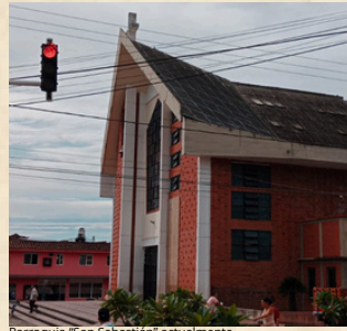
Parroquia "San Sebastián" actualmente.

De acuerdo con (Parra, 2024), después de un fuerte temblor en el año 62 que ocasionó grandes daños estructurales a la torre de la iglesia, y que por decisión del párroco Héctor Salazar, con la excusa de modernizar, la iglesia titulada Parroquia "San Sebastián", fue demolida en su totalidad; cambiando su infraestructura por completo y quedando irreconocible. Esta decisión, que pareció ser la más conveniente, tuvo muchas quejas comunitarias, ya que según relatos como el de (Parra, 2024), la iglesia era un tesoro municipal de gran valor, por lo que pareció una atrocidad haber destruido toda la estructura.