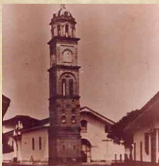
Parroquia "San Sebastián" antes de ser demolida.

Esto demuestra que no solo las grandes e influyentes estructuras le dan reconocimiento a un pueblo, pues la comunidad tiene el poder de hacer que cualquier estructura sea importante sin la necesidad de ser un elemento destacado de este. En palabras de (Betancourt, 2016), el nombre "Corredor Polaco" fue dado por una noticia que escucharon en un radio que había en el bar, la cual trataba de un corredor que daba salida a Polonia al mar báltico, pasando por una Alemania vencida después de la segunda guerra mundial.