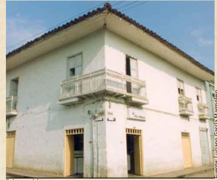
Balcones del parque antes.

En esta frase dejó claramente un mensaje de su tristeza por todas las estructuras que han sido destruidas y que siempre que se refirió a estas, las trataba como reliquias, obras maestras, hermosas; y una por una las describió detalladamente, con lo que demostró su interés y su empatía por todos estos monumentos que para muchos, solo son estructuras viejas, pero para él son el verdadero Roldanillo.