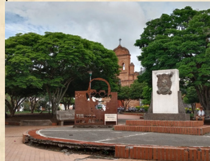
La capilla La Ermita ahora, con poca visibilidad.