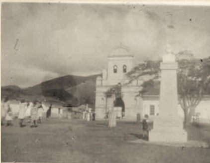
Capilla la Ermita años atrás.