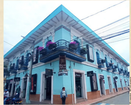
Balcones del parque ahora.