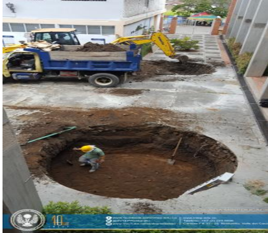
Preparación Traslado Palmas