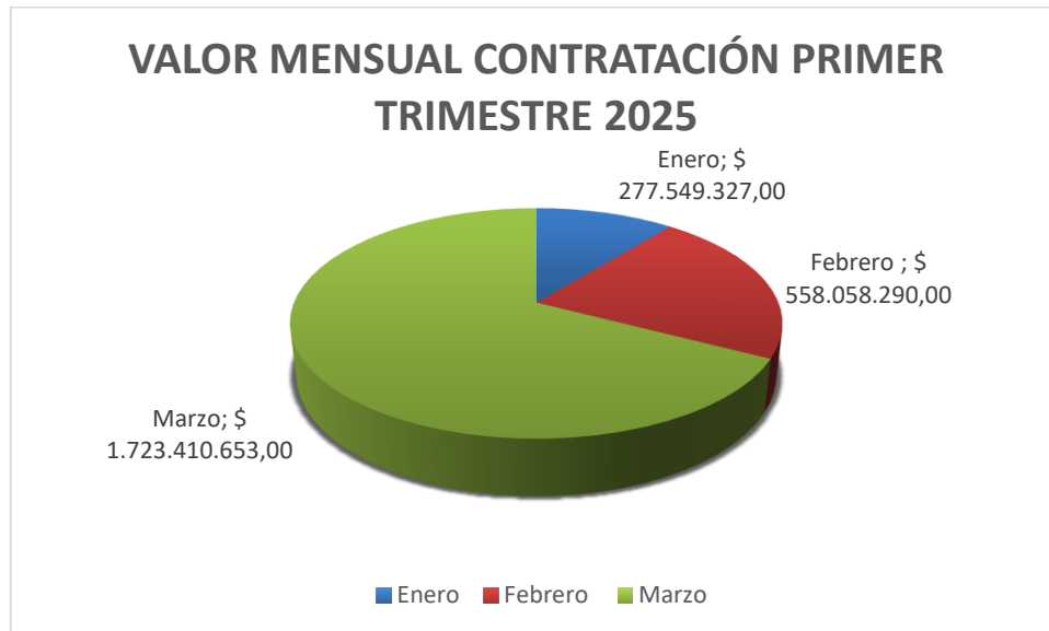
Figura 1: Valor mensual contratación primer trimestre 2025.