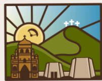
Tierra del Alma