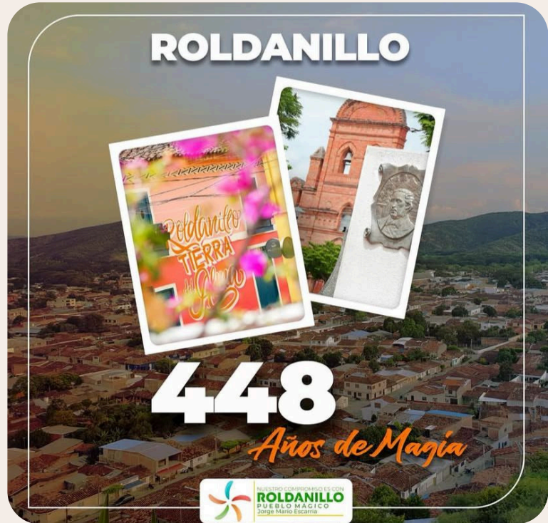
Alcaldía municipal de Roldanillo

Con la llegada de las redes sociales y el trabajo en equipo de comunicación actual, la imagen del municipio dio un giro. Para el equipo de comunicaciones, los afiches continúan siendo una forma clave de representar la identidad local, incluso con estilos modernos y contemporáneos.